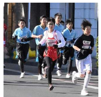
第66回 桐生市堀マラソン大会から