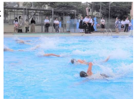
プール開き(6/1)の泳ぎ初めから