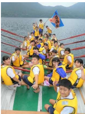
1組の学級旗「一致団結」

1年生が榛名高原学校に行ってきました。初日の午後には小雨が降りましたが、全ての日程をほぼ予定どおり実施することができました。そして、生徒一人一人がスローガンを意識して、みんなで協力し合って、計画に沿って、元気いっぱい生き生きと活動していました。体調を崩す生徒もなく、素晴らしい参加態度でした。今回深めることのできた『学級の絆・学年の絆』をこれからの学校生活に生かして行って欲しいと思います。