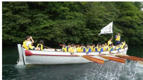
2組の学級旗「喜怒哀楽」