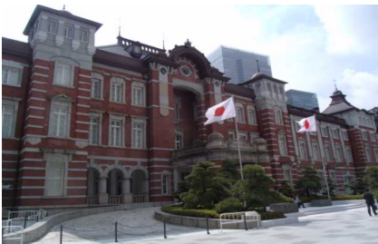
( 東京駅 )