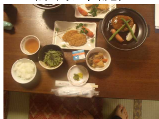
(2日目夕食ハンバーグ)