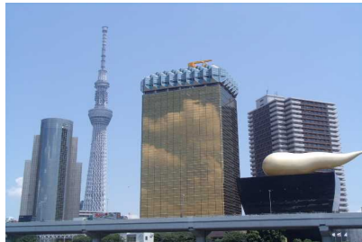
( 東京スカイツリー )