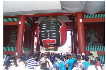
( 浅草雷門 )