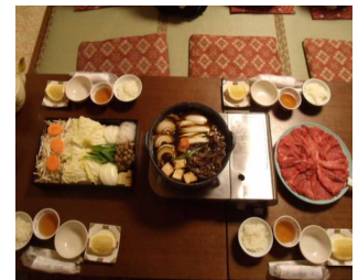
(1日目夕食すき焼き)