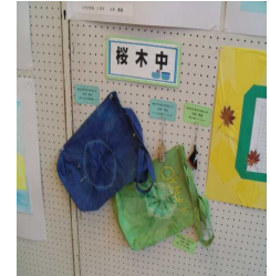
( 4 組 )