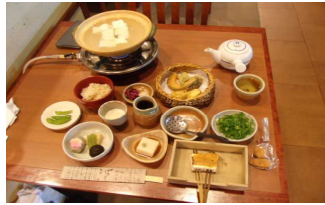
(南禅寺・昼食・湯豆腐)